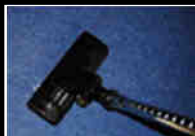
Aspiration Vacuum cleaning