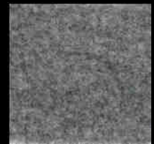
1725 Light Grey