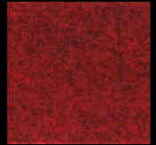
1702 Dark Red