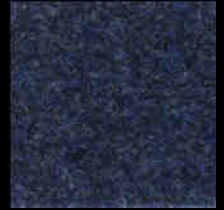
1704 Night Blue