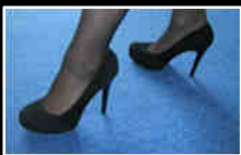
Chaussures / Shoes