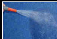
Jet d'eau Water jet