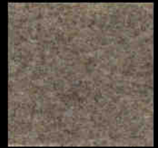
1706 Dark Beige