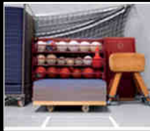
Facile à stocker Easy to store