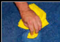
Nettoyage facile Easy cleaning