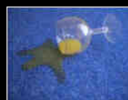
Liquides / Liquids