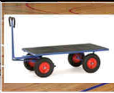
Facile à déplacer Easy to move