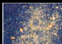
Salissures / Dirt